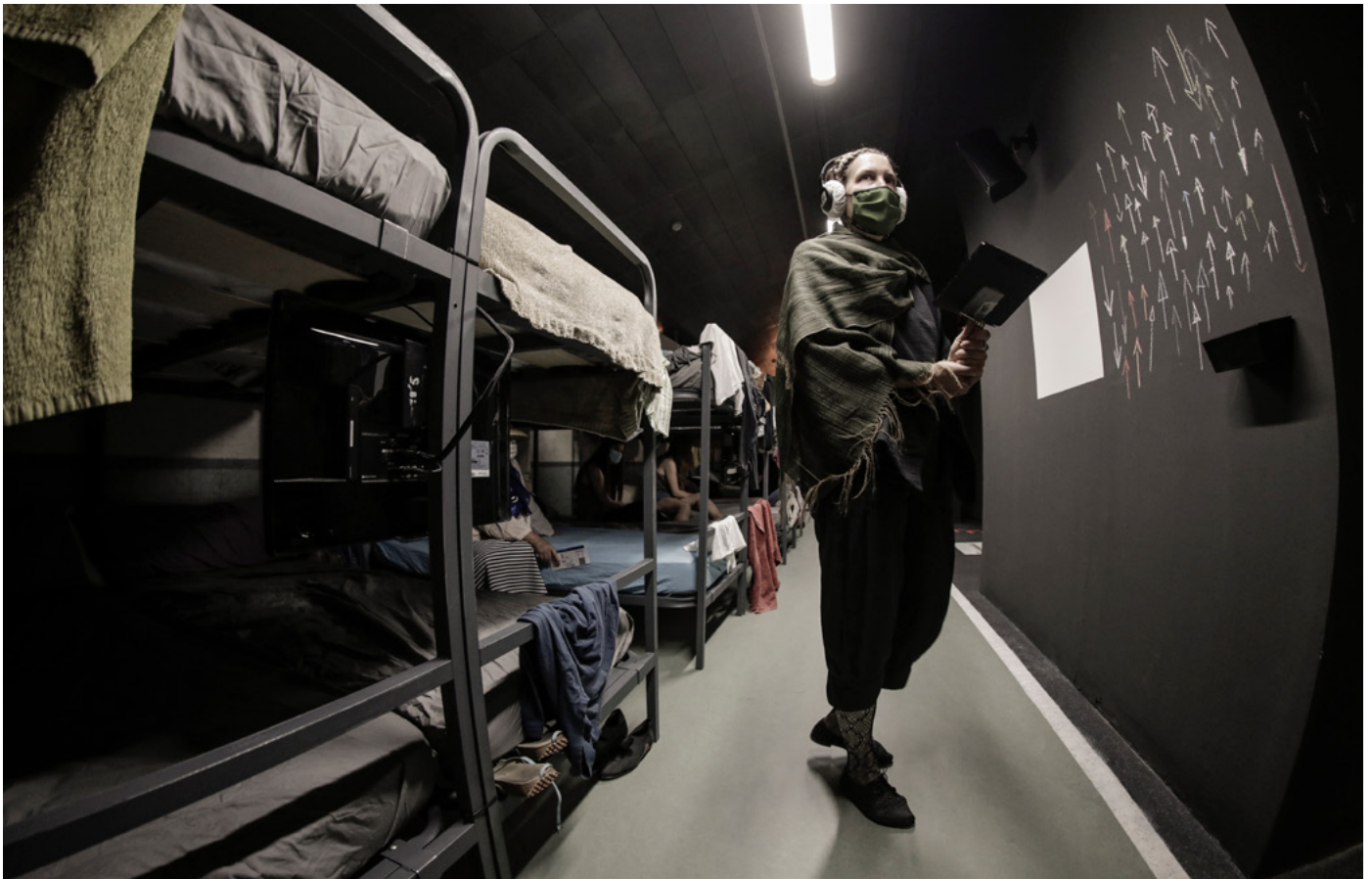
URBAN NATURE VON RIMINI PROTOKOLL AUSSTELLUNGSANSICHT

von Rimini Protokoll (Haug/Huber/Kaegi/Wetzel)