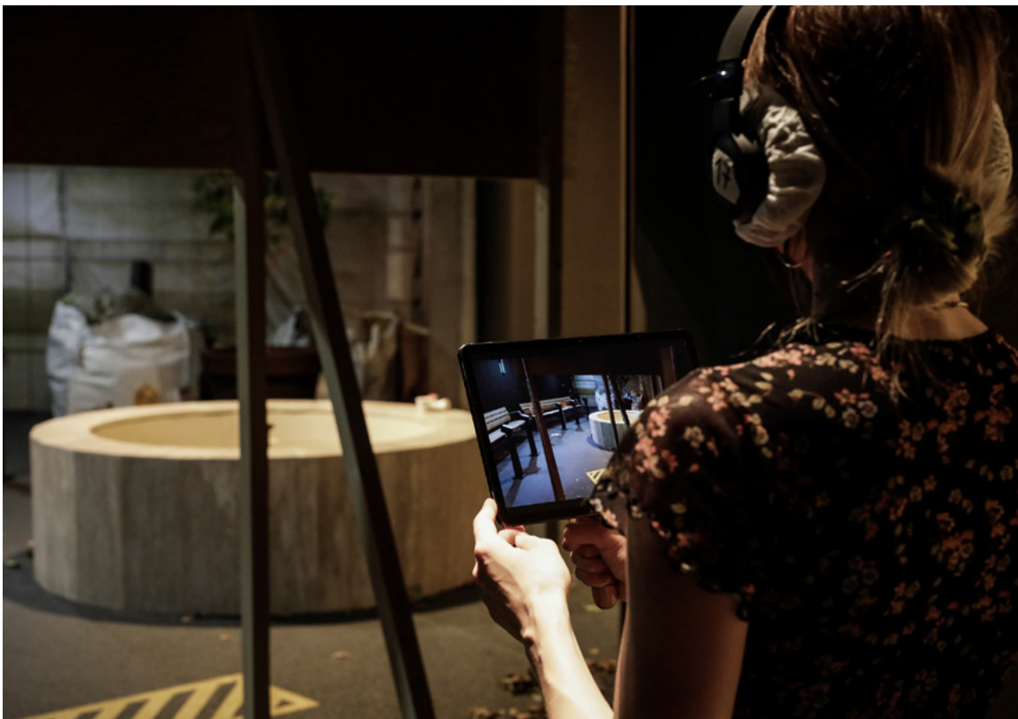
URBAN NATURE VON RIMINI PROTOKOLL AUSSTELLUNGSANSICHT