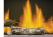
Ensemble Beach Fire