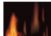
Panneaux réflecteurs radiants en porcelaine MIRO-FLAMME MD