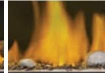
Ensemble Shore Fire (sable inclus)