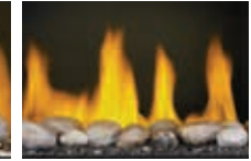
Ensemble Mineral Rock