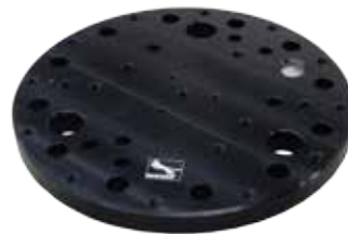
Base Plate (204776)

Panther entwickelte ein einzigartiges Baukastensystem , das im wesentlichen aus 2 Bauteilen besteht. Das Flex Grip Kit ist ein universelles Werkzeug für vielseitigen Einsatz. Es kann beliebig nach Ihren Bedürfnissen erweitert werden. Bereits mit dem Standard Kit kommen Sie groß raus!