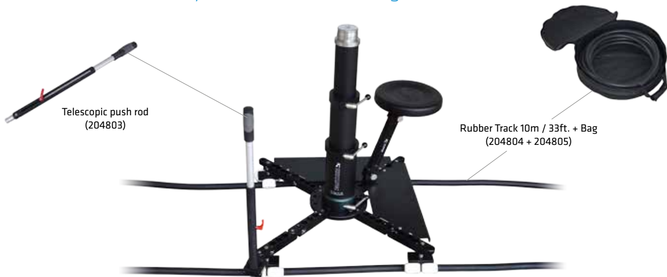
Telescopic push rod (204803)

Away from the table and straight on the tracks.