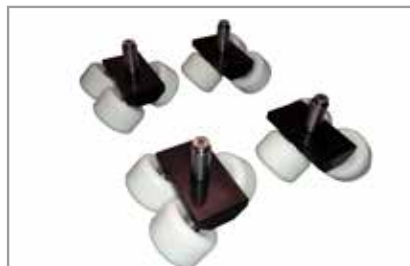
Skateboard Wheel Set (204793)

Levelling is easy by means of levelling feet if layed down the floor or by simply adjusting the height of the stand if mounted on a higher level.