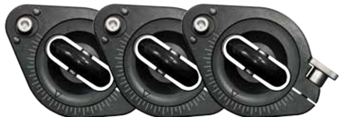
Inline Wheel (300064)

Eine ruhige, smoothe Kamerafahrt ist durch das neue Design von Inline Wheels (300064) gegeben. Auf glatten Oberflächen bewegt sich der Table Dolly nahezu geräuschlos und vor allem ruckfrei! Bodennahe Aufnahmen sind kein Problem dank des minimalen herausragens der Inline Wheels von 1,8 cm.