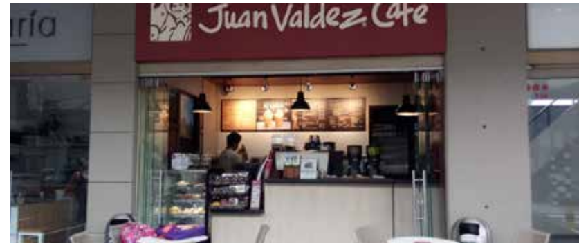
Juan Valdez, Centro Comercial San Lucas - Medellín, Colombia

y en Bogotá la de la Carrera Séptima con Avenida Jiménez, ubicada en pleno centro histórico de la ciudad, rodeada de museos, catedrales, historias y monumentos emblemáticos. Estas tiendas les permitirán a ciudadanos y visitantes del país, vivir una experiencia única disfrutando el mejor café.