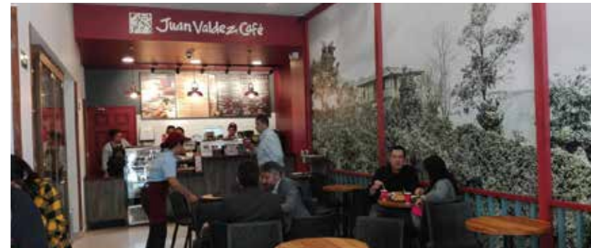
Juan Valdez, Carrera Séptima con Avenida Jiménez - Bogotá, Colombia