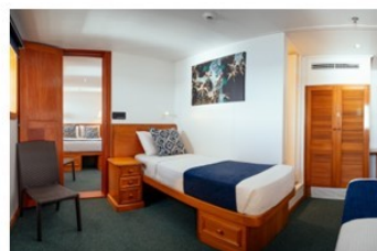
Connecting Family Ocean Stateroom