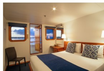
C & B Ocean Stateroom